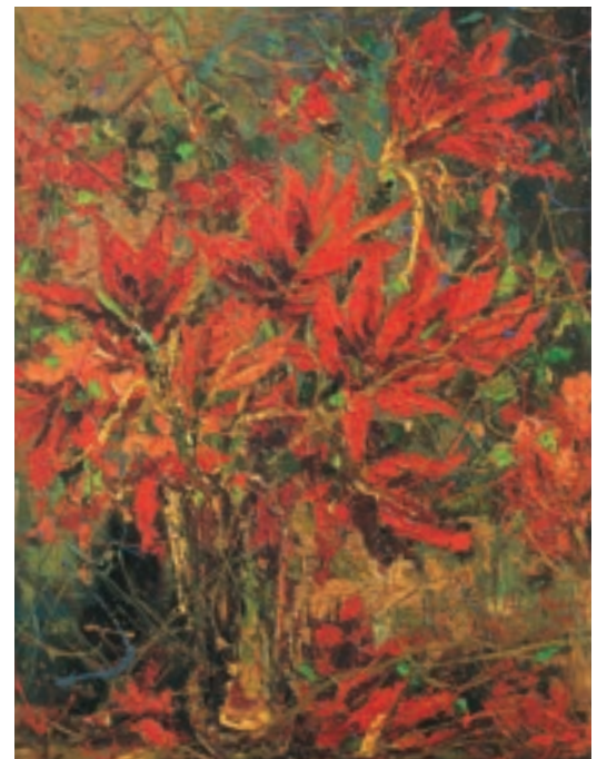
Atatürk Çiçekleri- 1967