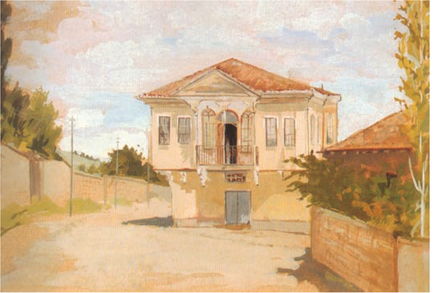
Doğduğum Ev - 1952