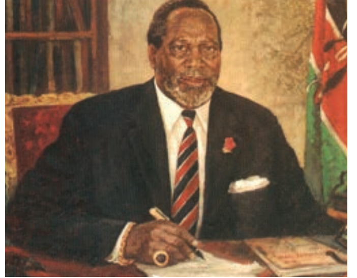
Jomo Kenyatta- 1966