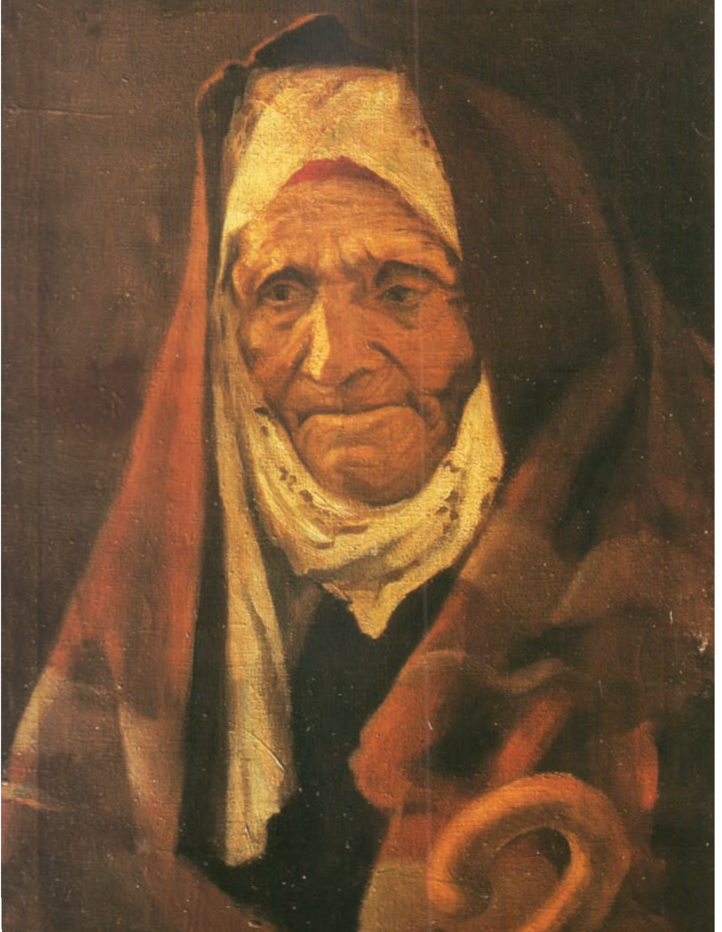
Nene Hatun- 1952