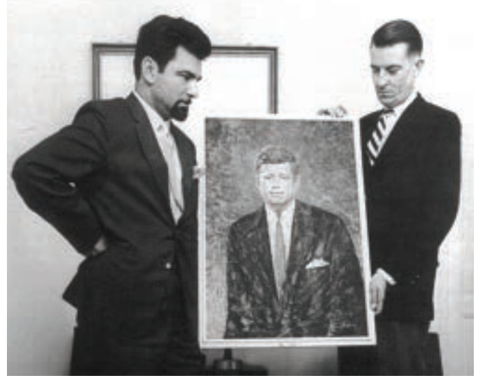
A.B.D Büyükelçisi ile