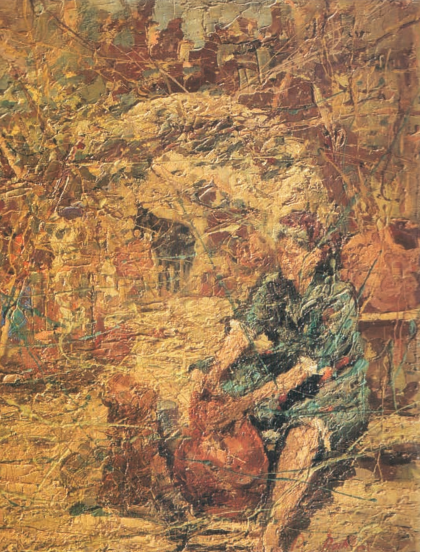
Günlük Nafaka- Girit 1966