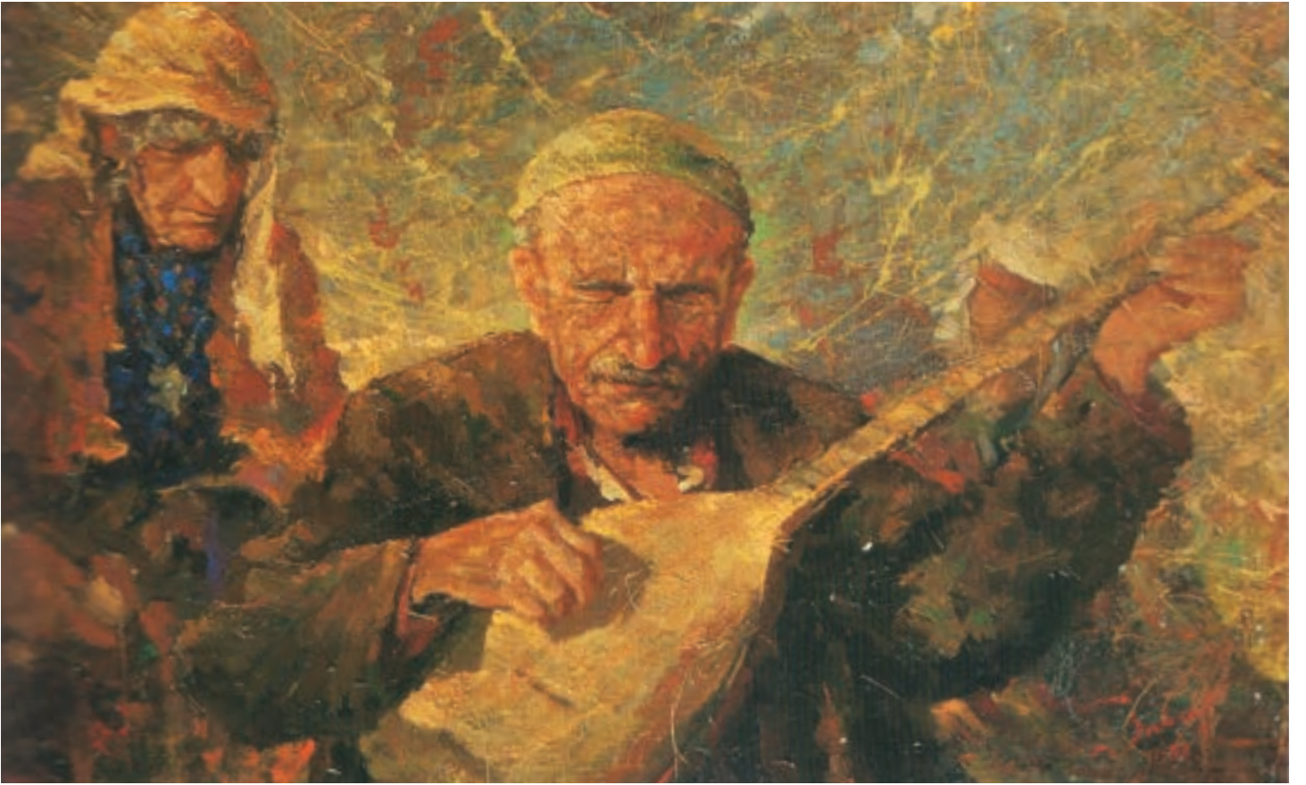
Aşık Veysel- 1973