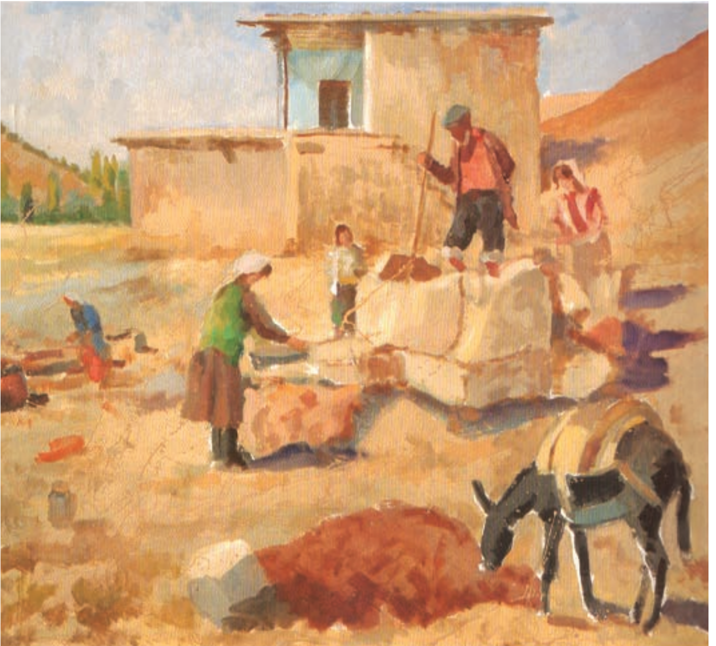
Keskin' de Pekmez Yapanlar- 1990