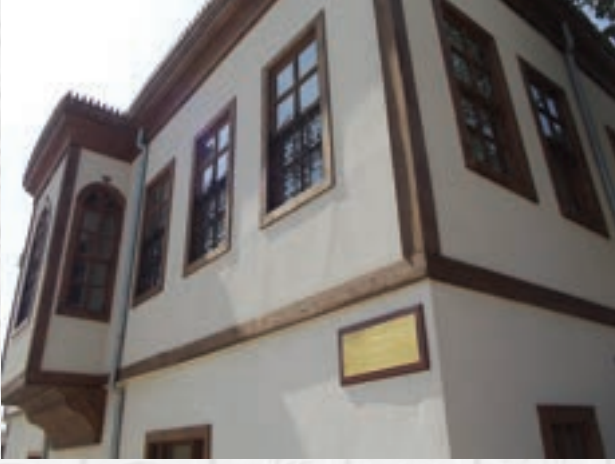
Rahmi Pehlivanlı Konağı ve Tarihi Keskin Evleri 1,2 Km

Tarihi dokusu ve güzellikleriyle; Tarihi Keskin Evleri, Rahmi Pehlivanlı Konağı, Taş Mektep, Kibritthane, Fişekhane, Karıstıran Mevkii ve Tarihi Ermeni Kilisesi, Şeşnigir Köprüsü, Ceritkale Kaya Mezarları bölgede görülmesi gereken yerlerden bazıları.