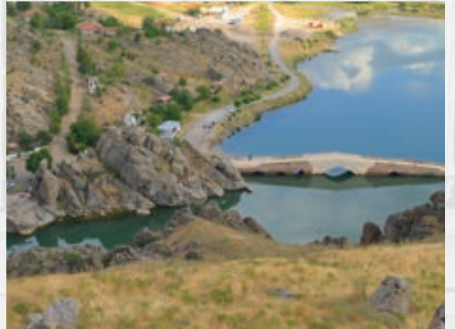
Şeşnigir Köprüsü 42,9 Km