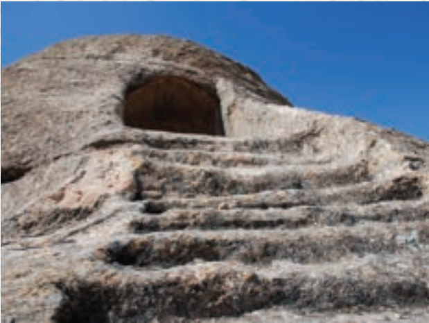
Ceritkale Kaya Mezarları 13 Km