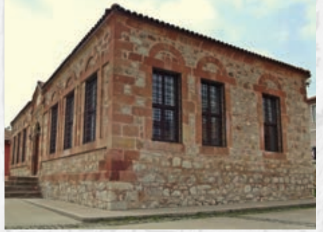
Taş Mektep Hacı Taşan Kültür Merkezi 1,4 Km